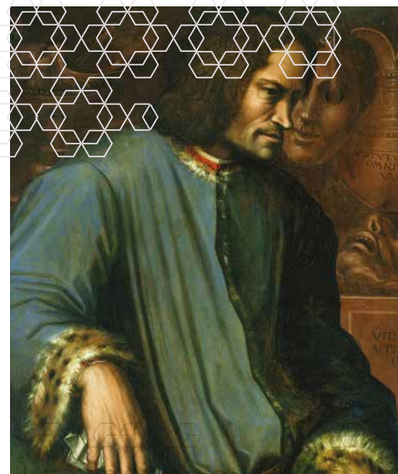
Kanskje er det gode i vårt sinn, og kan ikke nås av andre, bare av oss selv. Lorenzo