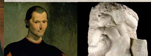
Når en fyrste er nødt til å lære seg den dyriske kampform, bør han velge reven og løven som forbilde. Machiavelli