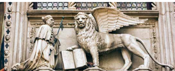
Fyllt av myter. Grunnlagt av Attilas flyktninger, gift med Poseidon, begunstiget av evangelisten Markus.