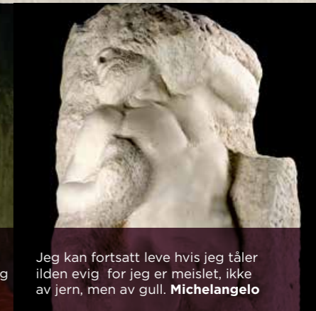
Jeg kan fortsatt leve hvis jeg tåler ilden evig for jeg er meislet, ikke av jern, men av gull. Michelangelo