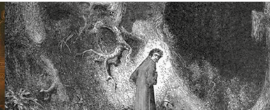
Midtveis på livets sti, som vi skal vandre, jeg fant meg inne i en dunkel skog, fordi jeg fra den rette vei var veket. Dante