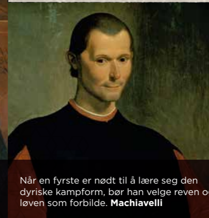
Når en fyrste er nødt til å lære seg den dyriske kampform, bør han velge reven og løven som forbilde. Machiavelli